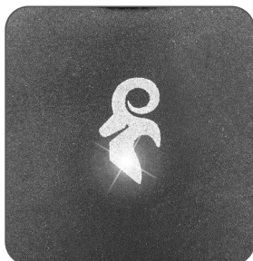
detail reflexního prvku detail reflexného prvku detail of the reflective element detal elementu odblaskowego