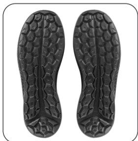
protiskluzová podešev protišmyková podošva slip-resistant outsole antypoślizgowa podeszwa