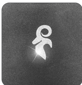
detail reflexního prvku detail reflexného prvku detail of the reflective element detal elementu odbłaskowego