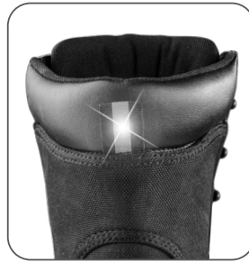
reflexní doplněk reflexný doplnok reflective accessory element odblaskowy