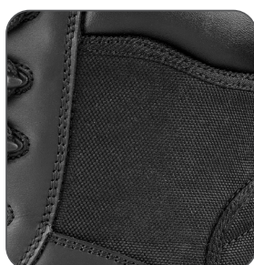
hydrofobní textilie hydrofóbna textília hydrophobic fabric hydrofobowa tkanina