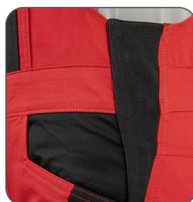
pruženka v bocích guma v bokoch elastic in the hips elastyczna gumka po bokach