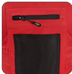
náprsní kapsy náprsné vrecká chest pockets kieszenie na piersi