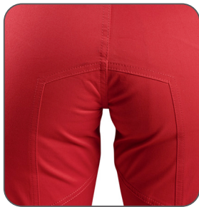
zesílený sed zosilnený sed reinforced seat wzmocnienie w kroku