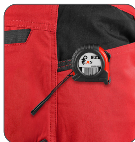
kapsa s vyztužením pro zavěšení metru vrecko s výstužou na zavesenie metra pocket with reinforcement for hanging a measuring tape kieszeń ze wzmocnieniem do zawieszenia miarki