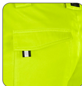
zadní kapsa zadné vrecko back pocket tylna kieszeń