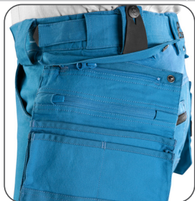
odepínací kapsy odnímateľné vrecká detachable pockets odpinane kieszenie