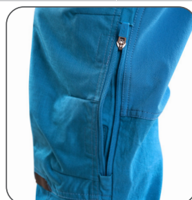
kolenní kapsy s boční ventilací a možností vložení kolenních výztuh kolenné vrecká s bočnou ventiláciou a možnosťou vloženia kolenných výstuh knee pockets with side ventilation and possibility to insert knee pads kieszenie na kolanach z bočną wentylacją i możliwością włożenia nakolanników