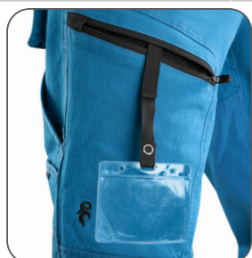
stehenní kapsa s vnitřním pouzdem na ID kartu stehenné vrecko s vnútorným pouzdom na ID kartu thigh pocket with inner ID card holder kieszeń na udzie z miejscem na ID kartę