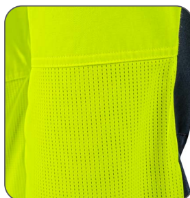
síťovina v zadní kolenní části sietovina v zadnej časti kolena mesh back knee part siatka z tyłu kolena