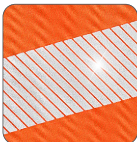
segmentované reflexní pásky segmentované reflexné pásky segmented reflective tapes segmentowe taśmy odbłaskowe