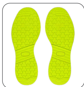
podešev podošva outsole podeszwa