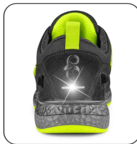
reflexní doplňky reflexné doplnky reflective accessories elementy odbłaskowe