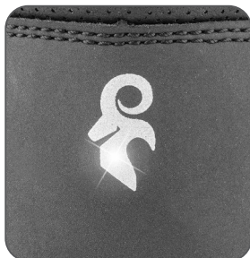
detail reflexního prvku detail reflexného prvku detail elementu odblaskowego