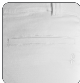
detail lištové zadní kapsy detail lištového zadného vrecka detail of a welt back pocket detal tylnej kieszeni z lamówką