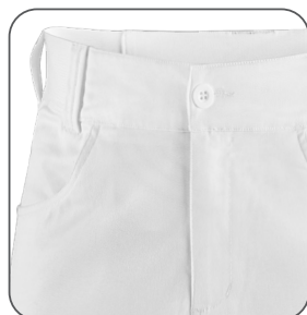
částečně elastický pas s poutky na opasek častočne elastický pás s pútkami na opasok partially elastic waist with belt loops częściowo elastyczny pas ze szlufkami na pasek