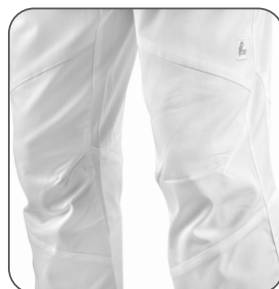
ergonomický střih kolen ergonomický strih kolien ergonomic knee cut ergonomiczny krój kolan