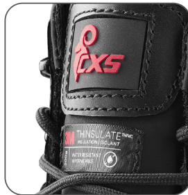
3M Thinsulate izolace 3M Thinsulate izolácia 3M Thinsulate insulation izolacja 3M Thinsulate