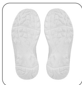
podešev podošva outsole podeszwa