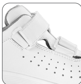
perforovaný svršek perforovaný zvršok perforated upper perforowana cholewka