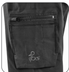
levá boční kapsa levé bočné vrecko left side pocket lewa kieszeń boczna