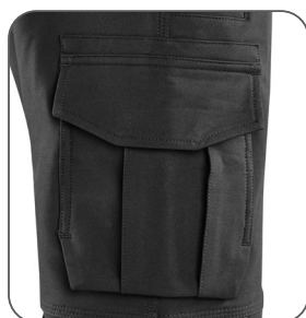
pravá boční kapsa s vnitřní kapsou na mobil pravé bočné vrecko s vnútorným vreckom na mobil right side pocket with an inner phone pocket prawa kieszeń boczna z wewnętrzną kieszenią na telefon