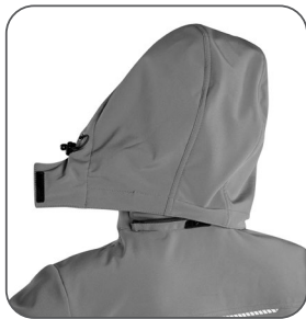
odepínací kapuce odnímateľná kapučna detachable hood odpinany kaptur