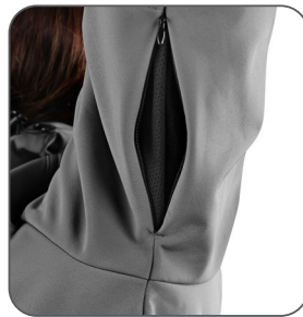
větrání v podpaží vetranie v podpažiu underarm ventilation wentylacja pod pachami