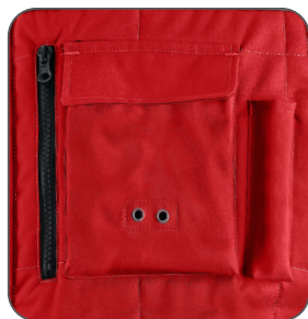
náprsní kapsa breast pocket kieszeń na piersi