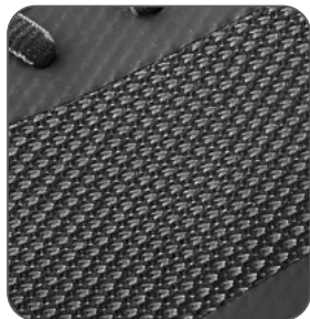
prodyšný svršek priedušný zvršok breathable upper oddychajúca cholewka