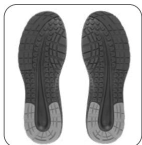
podešev podošva outsole podeszwa