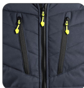
náprsní kapsy náprsné vrecká chest pockets kieszenie na piersi