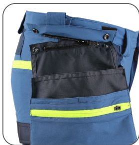
odepinací kapsy odpinacie vrecká detachable pockets odpinane kieszenie