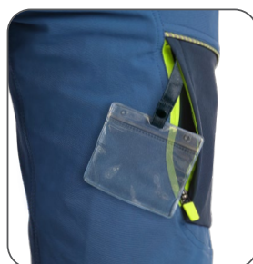
kapsa na stehně vrecko na stehne thigh pocket kieszeń na nogawce