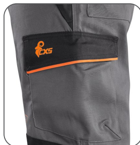
boční kapsa bočné vrecko side pocket kieszeń boczna