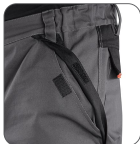
přední kapsa predné vrecko front pocket kieszeń przednia