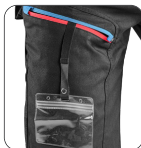
stehenní kapsa s vnitřním pouzdrmem na ID kartu stehenné vrecko s vnútorným puzdrom na ID kartu thigh pocket with inner ID card holder kieszeń na udzie z miejscem na ID kartę