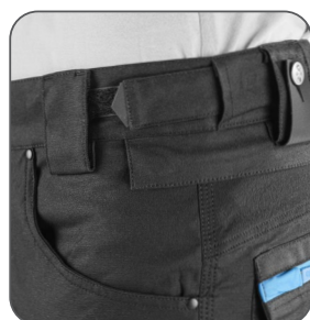
flexibilní pas flexibilný pás flexible waist elastyczny pas