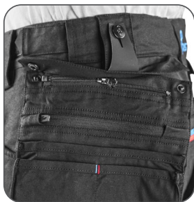
odepinací kapsy odpinacie vrecká detachable pockets odpinane kieszenie