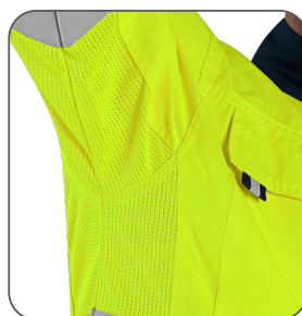
síťovina v podpaží underarm mesh siatka pod pachami