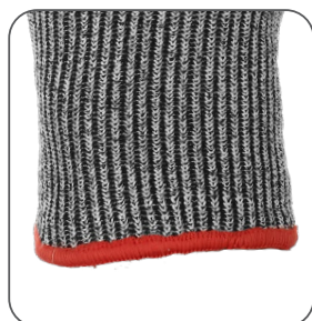
pružná manžeta pružná manžeta elastic cuff mankiet elastyczny