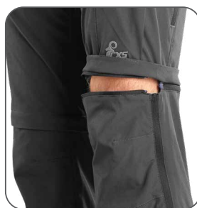
odepínací nohavice s barevným odlišením odnímateľné nohavice s farebným odlišením detachable legs with color differentiation odpinane spodnie z rozróżnieniem kolorystycznym