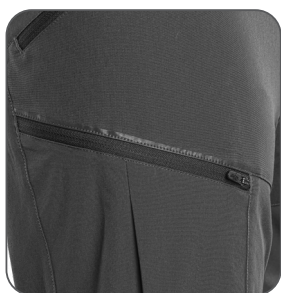
pravá boční kapsa pravé bočné vrecko right side pocket prawa kieszeń boczna